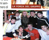
LA FORZA DEL GRUPPO

TTVIANELLO - Via Accademia Peloritana, 26 - 00147 Roma Tel - Fax (06) 54.103.95 - (06) 97.603.246 info@ttvianello.it - www.ttvianello.it